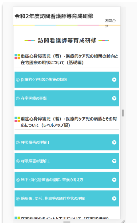
左：プログラム一覧